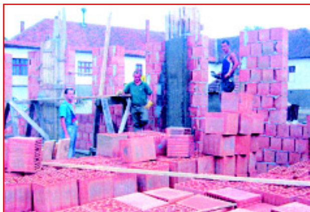
.... și azi, șantierul noului sanctuar penticostal din Păuliș