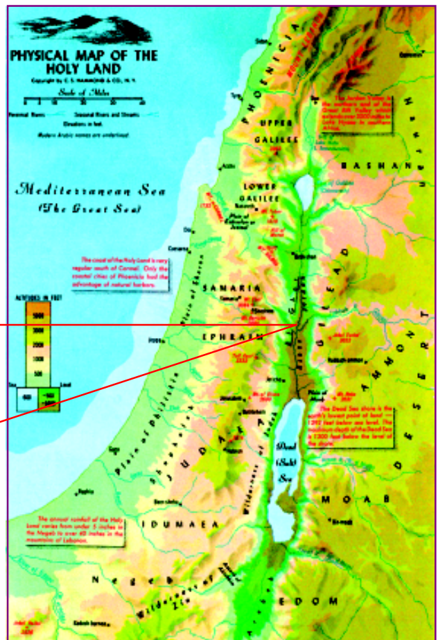
Foto stânga: locul unde se presupune că a fost botezat Isus în râul Iordan, în care și astăzi se fac botezuri creștine.